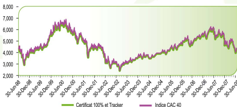
Graphique à caractère uniquement informatif.

La performance est calculée coupons réinvestis.